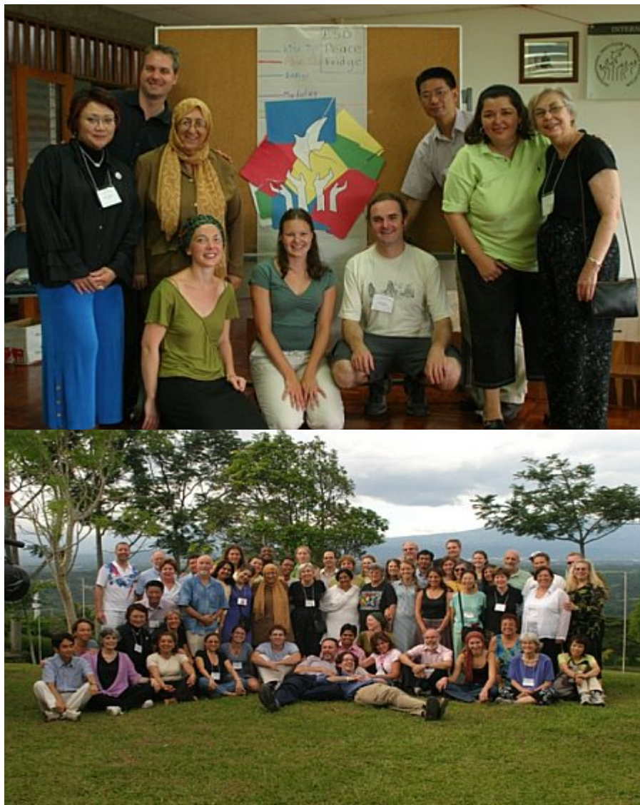
Participantes IPE 2006, Universidad de la Paz, Costa Rica